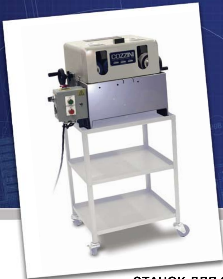
Станок с опциональной тележкой.